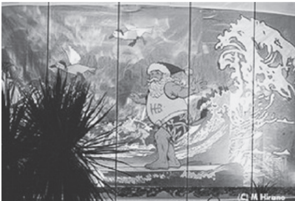
図2 サーフィンサンタの壁面 オーストラリアの巨大アート http://allabout.co.jp/travel/travelaustralia/closeup/CU20031219/

子ども達にとっても親しみ深い行事だからこそ、クリスマスの真意・他国との類似性や相違点をしっ