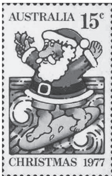
図3 サンタの切手 サーフィンをするサンタクロースの切手（オーストラリア 1977） http://yushu.or.jp/museum/kikaku/kikaku2/0401.html

かり伝えたい。相違点においては、その違いが大きいものと予想されるので、あえて指摘するのではなく、ひとりひとりの感受性を尊重することが大切となる。サーフィンに乗ったサンタクロースは、日本の子ども達にとって、違和感に溢れたものであろう。しかし、違いに戸惑い、違いを楽しむことこそ、この活動の趣旨となるべきある。また、サンタさんへの手紙では、サンタさんからの返信を期待できるように準備をしっかりとしておくことで、子ども達の創造力をさらに膨らませる要因として活用されるであろう。